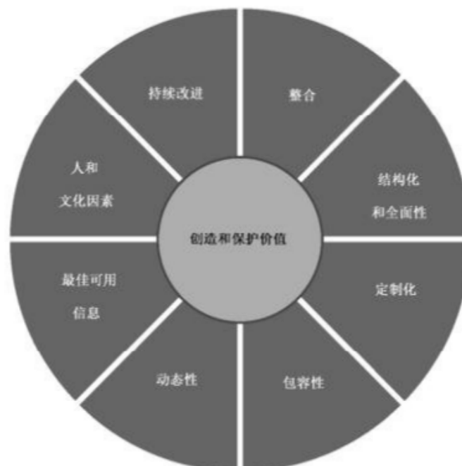
图 2 原则

图 2 列出的这些原则，为有效和高效的风险管理提供指导，阐述了风险管理的意图、目的和价值。这些原则是风险管理的基础，可在确立组织风险管理框架和过程时认真考虑。这些原则有助于组织管理不确定性对目标的影响。