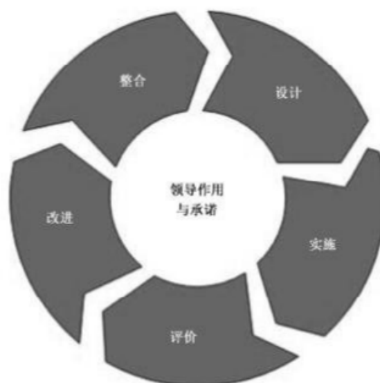
图 3 框架

框架制定包含在整个组织中整合、设计、实施、评价和改进风险管理。图 3 列举了风险管理框架的要素。